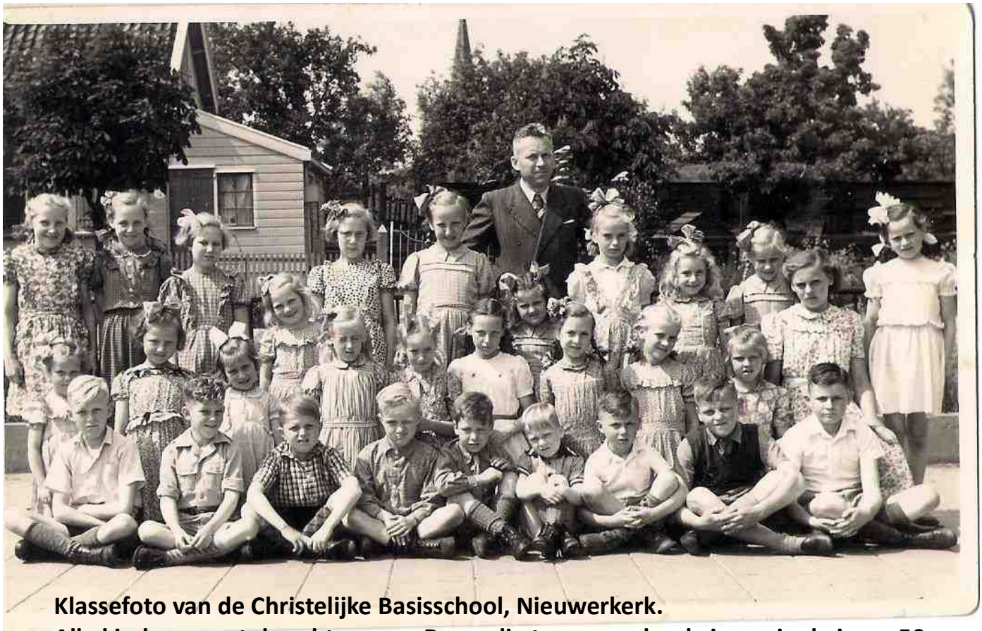
Klassefoto van de Christelijke Basisschool, Nieuwerkerk.

Met zonnig weer strooide vader tijdens het melken met de giftige DTT bus op de koeien tegen hinderlijke vliegen, toen normaal en nog niet verboden. Sommige boeren hadden tbc koeien, rauwe melk mocht je niet drinken maar dat werd wel gedaan. Er heerste besmettelijke ziektes onder de mensen, difterie, tbc en bij roodvonk kreeg je een bordje op de deur: ' Besmettelijk Roodvonk '. Van de Hoofdweg tot de Ringvaart was er weiland, de nieuwe spoorlijn werd daar doorheen gelegd, wij speelden in het zand. De oude spoorbaan is nu de Abraham van Rijckevorselweg, het station staat er nog. Als kleuter ging ik enkele maanden naar de nieuw geopende kleuterschool naast de lagere school. In de oorlog maalden we koren en bakte zelf brood. We kerkten in de Hervormde kerk en gingen op de zondagschool.